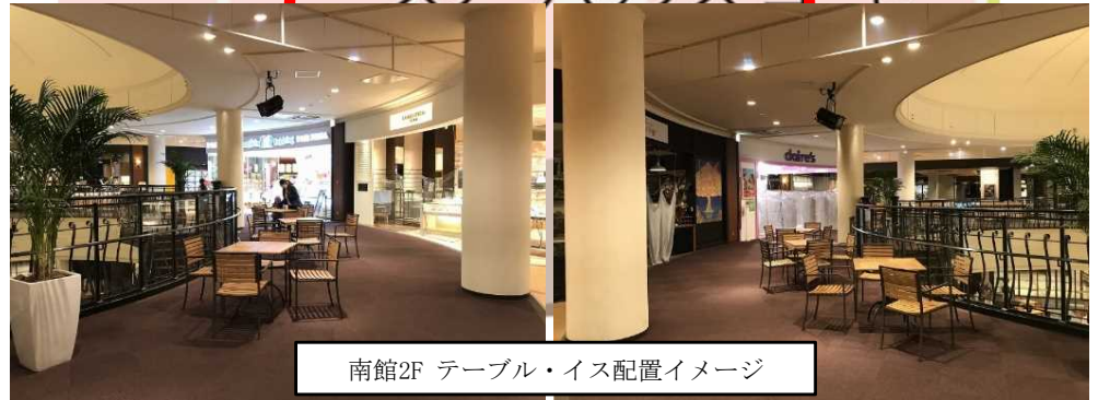
南館2F テーブル・イス配置イメージ