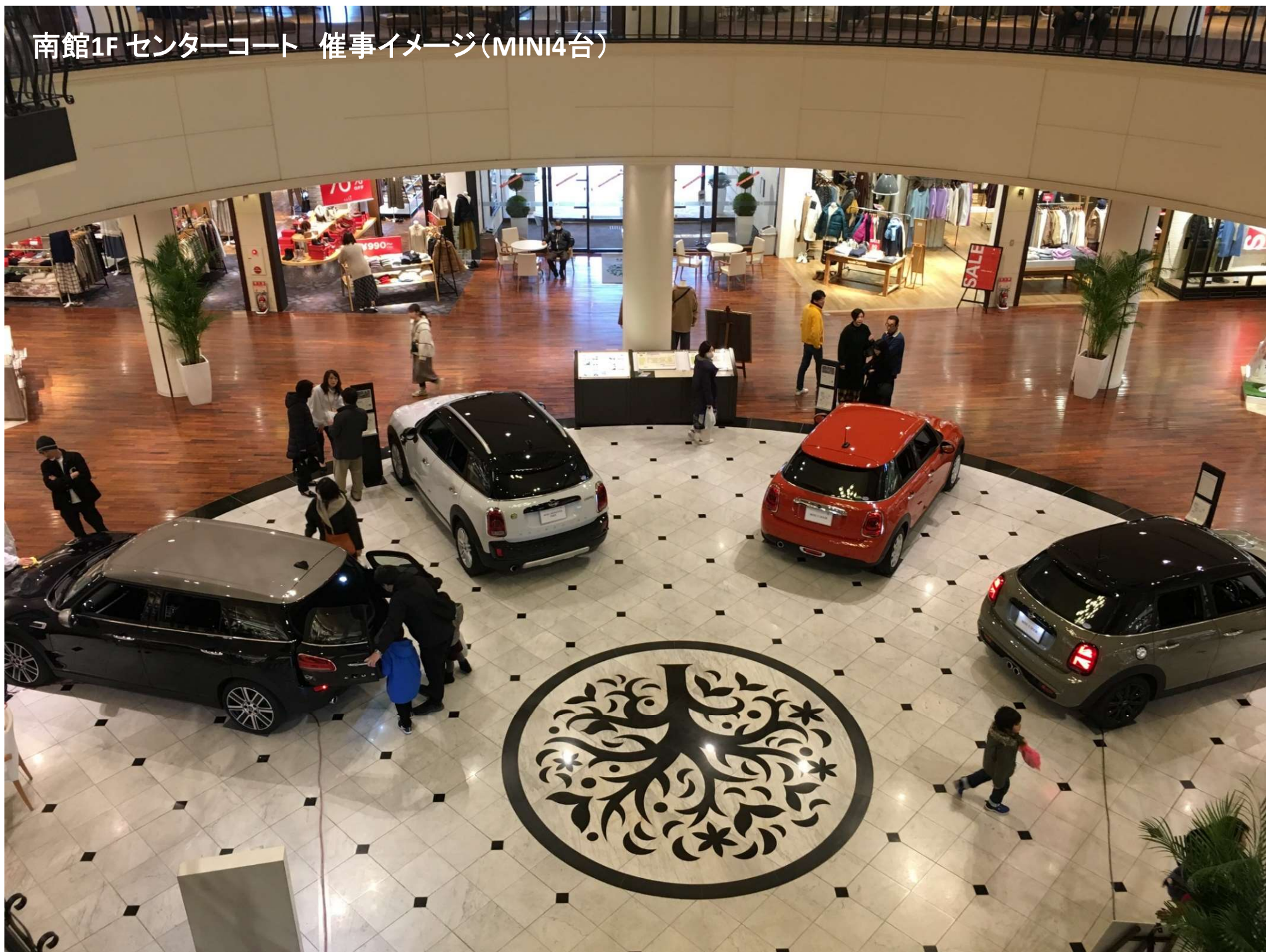
南館1F センターコート 催事イメージ(MINI4台)